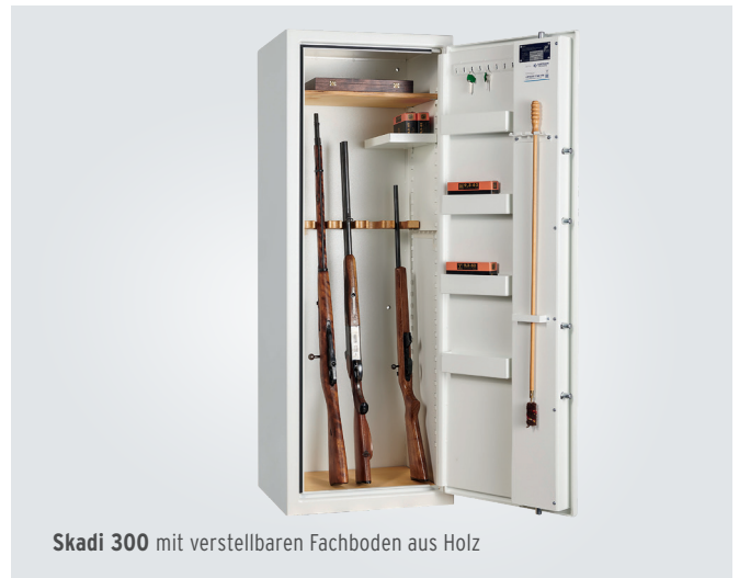
Skadi 300 mit verstellbaren Fachboden aus Holz

Durch recyclingfähigem Naturmaterialien konnte der CO 2 -Fußabdruck um 11,2 % reduziert werden