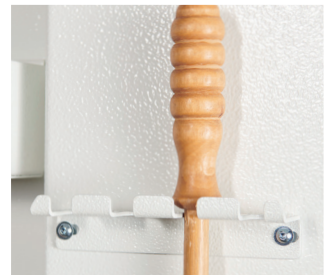
Putzstockhalter aus Metall