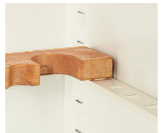
Waffenhalter magnetisch höhen-/tiefenverstellbar aus Kiriholz