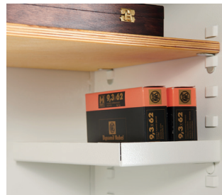
Teilfachboden aus Metall