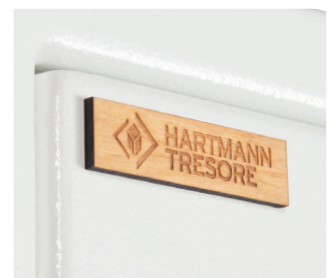
Holzblech Hartmann Tresore