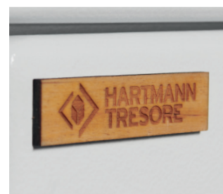
Holzblem Hartmann Tresore