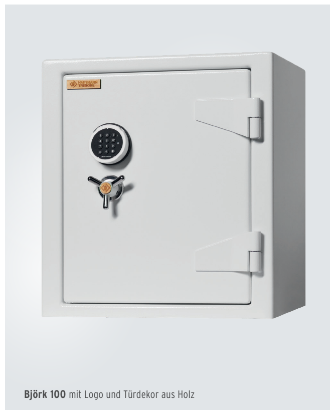
Björk 100 mit Logo und Türdekor aus Holz

Nachhaltig sauber Durch recyclingfähigem Naturmaterialien konnte der CO 2 -Fußabdruck um 11,2 % reduziert werden