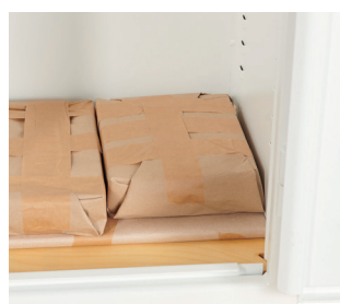
Verpackung zu 100% plastikfrei