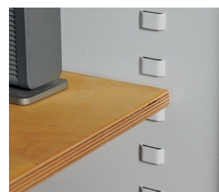
Fachboden aus Holz