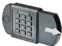
Abb. 1: Eingabeeinheit Primor FE

Wechseln Sie schnellstmöglich die Batterie. Die programmierten Codes bleiben während des Batteriewechsels erhalten. Bitte entsorgen Sie gebrauchte Batterien stets umweltgerecht.