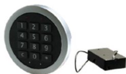
Abb. 3.: Eingabeeinheit Primor FL/Batteriefach